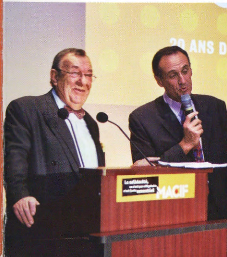
Bernard Thibault Secrétaire général de la CGT

"La Macif se distingue des autres entreprises présentes sur le marché, notamment en reconnaissant à chacun de ses assurés et collaborateurs la possibilité de participer activement au mouvement mutualiste."