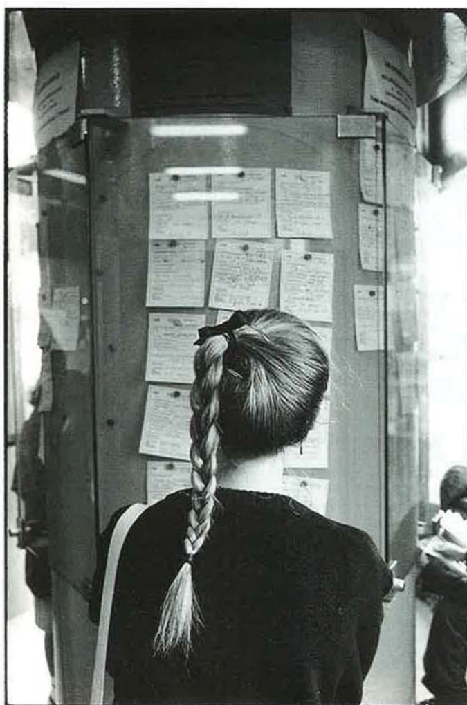
Personne n'est à l'abri du chômage...

Il s'agit tout naturellement pour notre Mutuelle de rester fidèle aux principes de partage et d'entraide qui sont sa raison d'être. Au-delà de l'obligation de garantir au