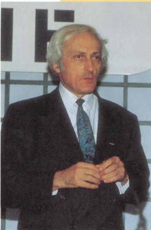
Pierre Juvin, président de la région Rhône-Alpes

Inutile, donc, voire dangereux, de se lancer en quête d'une autre philosophie d'entreprise. Point de salut dans l'appel des sirènes des grandes