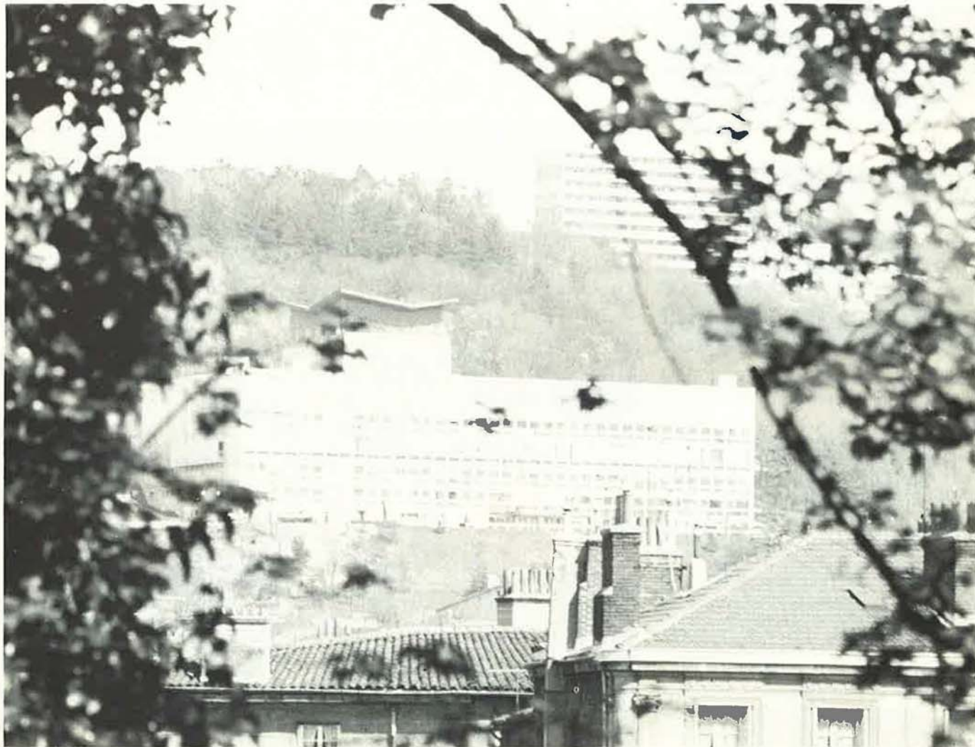
Vue de la Maison de la Culture où eurent lieu les assemblées générales.

A l'appui de chaque liste peut être jointe une déclaration électorale qui ne doit pas dépasser une feuille dactylographiée recto-verso. Le contenu de cette déclaration doit se rapporter à la gestion de la mutuelle, à l'exclusion de toute polémique d'ordre politique, philosophique ou religieux.