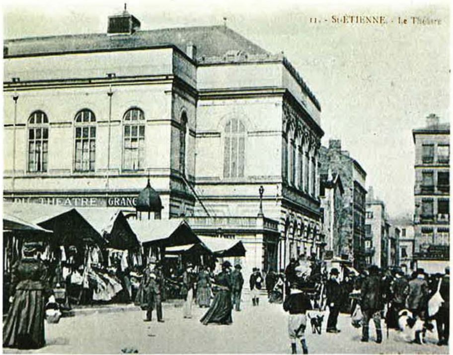
1900 : le marché du Théâtre.

« Dans sa lettre du 2 avril 1975, le conseil d'administration de notre Mutuelle propose de soumettre à la prochaine assemblée