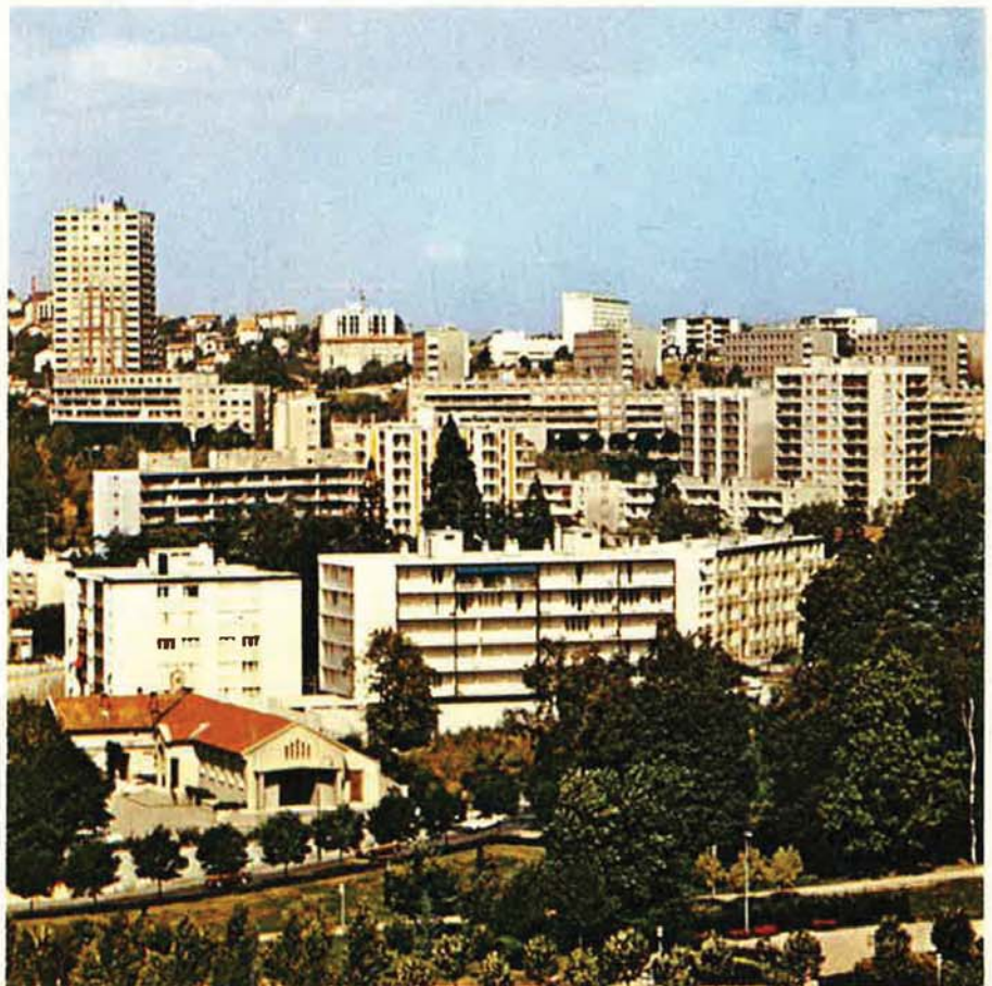
1975 : un quartier résidentiel.