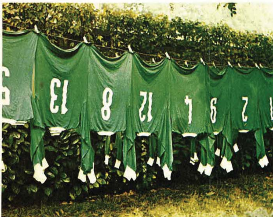
SPORTIF : les maillots de l'A.S.S.E.

auparavant, était fixé par l'assemblée générale, est désormais arrêté par le conseil d'administration.